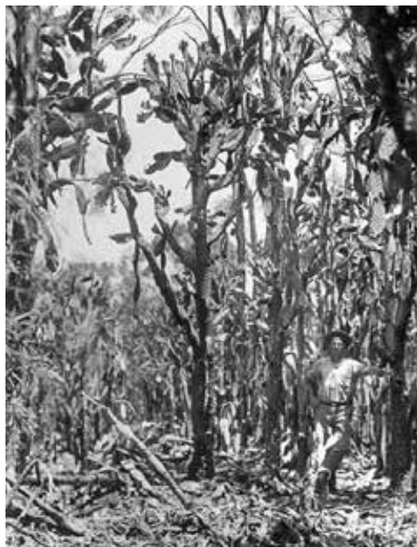
Immigrant in jungle van prickly pear cactussen