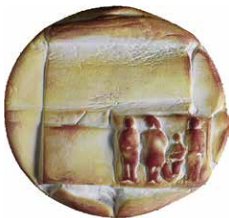
Brisbane, de nieuwe generatie. Terracotta, 80 mm