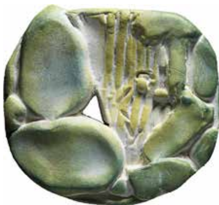
Cattle Creek, de pioniers (voorzijde). Terracotta, 70 mm

(90 mm diameter) in terracotta met de tekst CATTLE CREEK DUTCH IMMIGRANTS 1908 1920 rondom de weergave van een ruig landschap. Verdere uitwerking resulteerde in twee penningen: Cattle Creek en Brisbane . Het uitgangspunt voor de penning Cattle Creek - De pioniers (70 mm diameter) is een foto uit die tijd waarop een immigrant staat afgebeeld; een man staande in een wildernis van huizenhoge zogenoemde prickly pear cactussen. Op de penning staat hij oververmoeid, leunend tegen zo'n enorme cactus. Zijn hoed is achterover gezakt, dat geeft hem zo een halo, een krans van een heilige. Dat is niet religieus bedoeld, maar in de ogen van Steyn was hij wel een soort heilige: een pionier, een strijder tegen de jungle. In feite is op de penning alleen het hoofd van de oververmoeide figuur