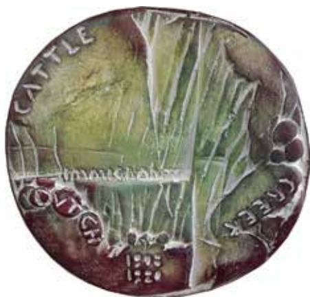
Cattle Creek. Enkelzijdig proefontwerp, terracotta, 90 mm

(90 mm diameter) in terracotta met de tekst CATTLE CREEK DUTCH IMMIGRANTS 1908 1920 rondom de weergave van een ruig landschap. Verdere uitwerking resulteerde in twee penningen: Cattle Creek en Brisbane . Het uitgangspunt voor de penning Cattle Creek - De pioniers (70 mm diameter) is een foto uit die tijd waarop een immigrant staat afgebeeld; een man staande in een wildernis van huizenhoge zogenoemde prickly pear cactussen. Op de penning staat hij oververmoeid, leunend tegen zo'n enorme cactus. Zijn hoed is achterover gezakt, dat geeft hem zo een halo, een krans van een heilige. Dat is niet religieus bedoeld, maar in de ogen van Steyn was hij wel een soort heilige: een pionier, een strijder tegen de jungle. In feite is op de penning alleen het hoofd van de oververmoeide figuur